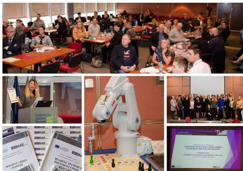
Medzinárodná konferencia skillME sa konala 4. októbra 2017 v Ľubľane v Slovinsku.

Cieľom konferencie bolo predstaviť osvedčené postupy a inovatívne prístupy pri vyplňaní medzier v zručnostiach, zosúladienie zručností s potrebami trhu práce, rozvoj nových zručností pre nové pracovné miesta, prispôbenie národných stratégií s cieľom zlepšiť kvalitu a efektívnosť odborného vzdelávania a prípravy a zvýšiť konkurencieschopnosť pracovníkov. Boli predložené rôzne prístupy k posilňovaniu odborného vzdelávania a prípravy v zúčastnených krajinách Slovinsku, Slovensku, Lotyšsku a Chorvátsku a národné stratégie implementácie učebných osnov navrhnutých do národných rámcov OVP v rámci projektu skillME. Školitelia a študenti okrem toho predstavili svoje konkrétne skúsenosti s implementáciou pilotných školení a preukázali ich využiteľnosť a výsledky. Ako príklad slúžilo školenie Machine Vision - používanie kamery na kontrolu robotov, ktoré prezentovali študenti Strednej odbornej školy Stará Turá. Viac informácií o konferencii nájdete na internetovej stránke projektu.